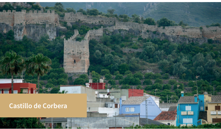
Castillo de Corbera

Sueca: el 29 de julio la fiesta de los Benissants de la Pedra, en septiembre del 1 al 8, la Feria y Fiestas en honor a la Mare de Déu de Sales seguida por La Festa de l'Arròs con el Concurso Internacional de Paella Valenciana de Sueca y Firarròs. La segunda quincena la Mostra Internacional de MIM (Mimo) En marzo 16 comisiones falleras dan vida a esta fiesta que se remonta a 1876, cuando se plantó el primer monumento. En el Perelló el 16 de julio, la Mare de Déu del Carme. En Pascua, la Mare de Déu del Roser en el Mareny de Barraquetes .