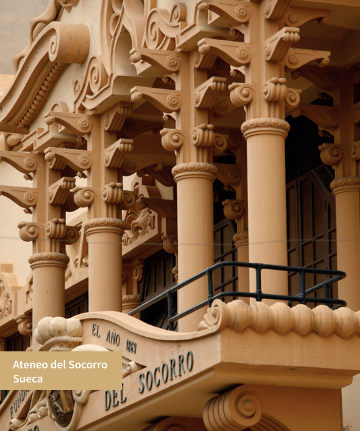
Ateneo del Socorro Sueca

Benicull del Xúquer: Del 18 al 22 de agosto, fiestas en honor a la Beata Inés. A principios de julio, Hijas de María.