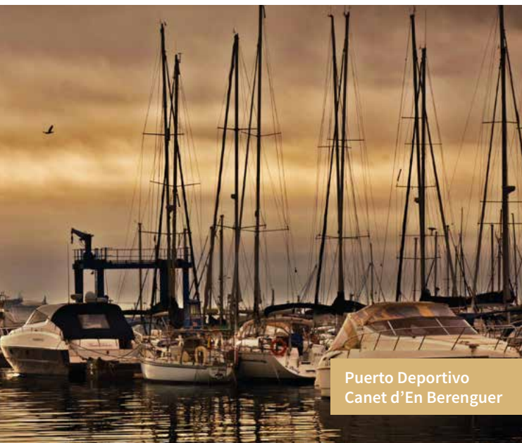
Puerto Deportivo Canet d'En Berenguer

Continuando nuestro recorrido por el Camp de Morvedre, nos acercaremos a Benifairó de les Valls , donde nos esperan su Ermita de la Virgen del Buen Suceso y los parajes naturales del Monte de la Rodana.