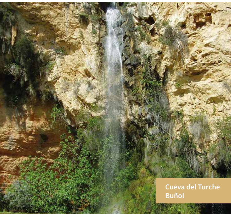
Cueva del Turche Buñol

La ruta de los Molinos es fácilmente transitable, a pie, en bicicleta o incluso a caballo; cuenta con paneles informativos sobre los antiguos molinos y construcciones realizadas para el aprovechamiento del agua.