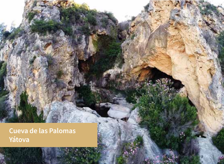
Cueva de las Palomas Yátova