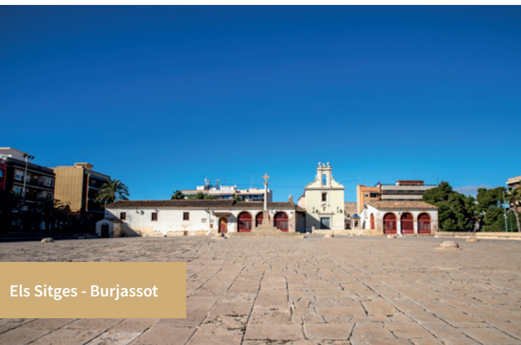
Els Sitges - Burjassot