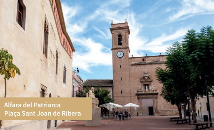
Alfara del Patriarca Plaça Sant Joan de Ribera

Santa Bàrbara, es pot veure una gran quantitat d'edificis eclesiàstics i religiosos –alguns habilitats com a centres universitaris–, l'església de Sant Jaume i l'ermita de Santa Bàrbara o el Museu de la Seda; a Vinalesa, la rehabilitada Fàbrica de la Seda, construïda en el segle XVIII, que va ser la més important de la comarca.