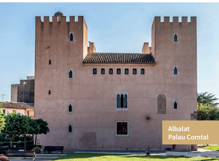
Albalat Palau Comtal

Seguint la ruta cap al Puig de Santa Maria, els pobles –tots antigues alqueries àrabs– s'endevenen des de lluny a través dels seus esvelts campanars i se succeeixen fins que quasi es confonen. A l'església parroquial d'Almàssera es pot veure l'arqueta que guarda les formes eucarístiques del miracle dels peixets i al marge esquerre del barranc de Carraixet, Bonrepòs i Mirambell disseminen la seua població per diverses alqueries. A Meliana, l'església dels Sants Joans, de construcció renaixentista i recoberta amb elements xoriguerescos, i les ermites de la Mare de Déu de la Misericòrdia (erigida en memòria de