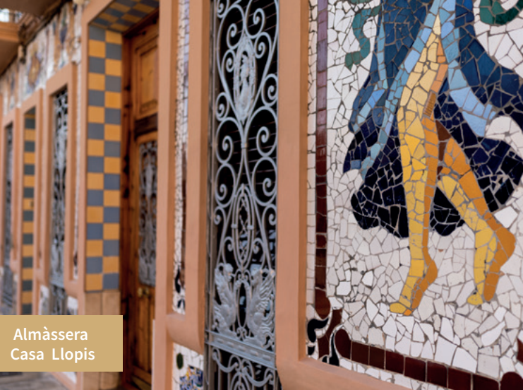
Almàssera Casa Llopis

la conquesta d'aquestes terres per Jaume I) i del Crist de la Providència mereixen una visita. Abans de continuar, es poden adquirir els populars mosaics que es fabriquen ací des de 1860. A Foios, l'església de Nostra Senyora de l'Assumpció guarda una imatge del segle XV de la Mare de Déu del Patrocini, la seua patrona, i, enmig de l'horta, l'ermita del Crist de la Sang.