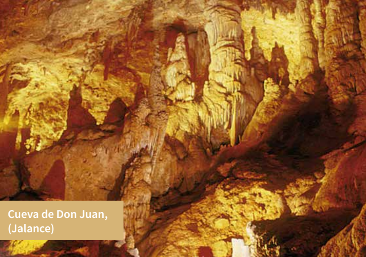
Cueva de Don Juan, (Jalance)

Destacamos el Parque de Coníferas de Jarafuel , así como las Aulas de Naturaleza de la Hunde y el Moragete, el Campamento de Turismo de Las Jaras y el Coto Social de Palomeras. Todo ello sin olvidar las aportaciones al mundo actual de las modernas tecnologías, como la Central Nuclear de Cofrentes y el gran complejo hidroeléctrico de Cortes-La Muela, con una impresionante central subterránea. Entre Cofrentes y la presa de Cortes hay un tramo navegable de casi 14 km de recorrido, atravesando paisajes de gran belleza. Funciona una ruta fluvial a través de una naturaleza privilegiada junto a la reserva nacional de la Muela de Cortes, que ofrece al viajero paisajes espectaculares y solitarios durante todo el año.