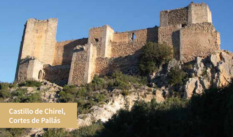
Castillo de Chirel, Cortes de Pallás

alturas superan los mil metros de altitud: Puntal del Conejo (1.066 m), Montemayor (1.105 m), Caroché (1.128 m), y el Pico Palomera, que con sus 1.260 m. es la cumbre principal de la comarca.