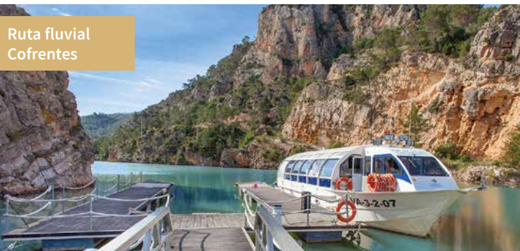
Ruta fluvial Cofrentes

En Jalance se encuentra una empresa familiar de conservas artesanales de exquisita calidad, amén de la miel de producción casi ancestral, pues su recolección aparece ya documentada en pinturas rupestres, y que hoy perdura, celebrándose en el mes de octubre la Feria del Primer Corte de la Miel , en Ayora .