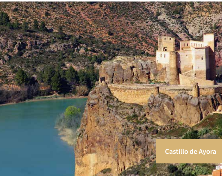
Castillo de Ayora

En medio quedan los pueblos de Jarafuel , Teresa de Cofrentes y Zarra y, un poco más aislado, Cortes de Pallás . El Valle es como una verde alfombra rodeada de elevadas montañas cubiertas de pinares y de romeros, retama, esparto y tomillos, alternando con enebros, coscoja y madroños, cuyas