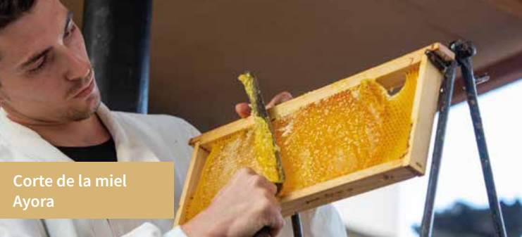
Corte de la miel Ayora