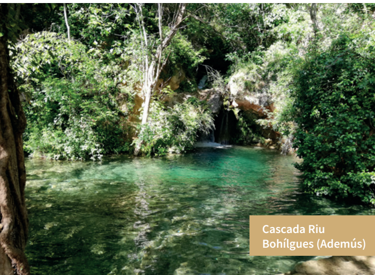
Cascada Riu Bohígues (Ademús)

En els dos llocs, riu i bosc, s'ofereix caça i pesca als aficionats a aquests esports, que hi troben sobrats al·licients per a cobrar bones peces i excel·lents captures. Per als amants del senderisme i activitats a l'aire lliure, el Racó d'Ademús és un enclavament ecològic privilegiat, perquè els seus valors paisatgístics són excepcionals i en les seues muntanyes es conserva tota una valuosíssima varietat de la flora i fauna mediterrània, amb arbres en els seus boscos catalogats com a monumentals, i un