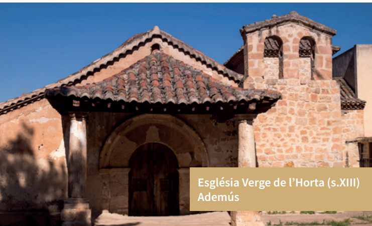
Església Verge de l'Horta (s.XIII) Ademús

Ademús amaga un dels seus tresors més preuats, el poblat iber de La Celadilla, que constitueix un dels jaciments més singulars de la península Ibèrica. Visitable amb el servei d'experiències per a conèixer més a fons les últimes troballes que es duen a terme.