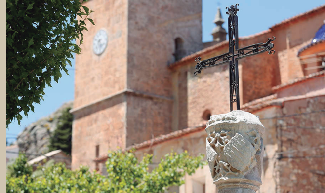
Cruz de Andilla

✔ Al final de esta bajada atravesaremos el pequeño barranco de Juansomera sobre un pequeño puente medieval antes de llegar a las Nogueras de las Almas (3), nombre con el que se conocía dos nogales centenarios, que tuvieron una talla considerable pero