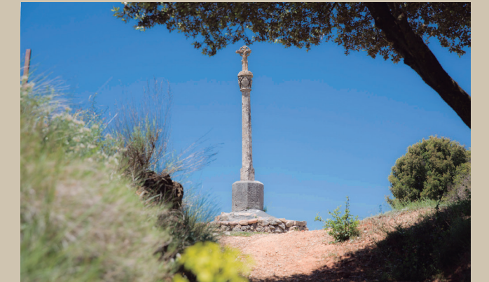
Cruz de la Horca

✔ Una vez dentro del casco histórico, pasaremos por la Calle Mayor hasta llegar a la Plaza de la Muralla, punto de inicio y fin de esta ruta.