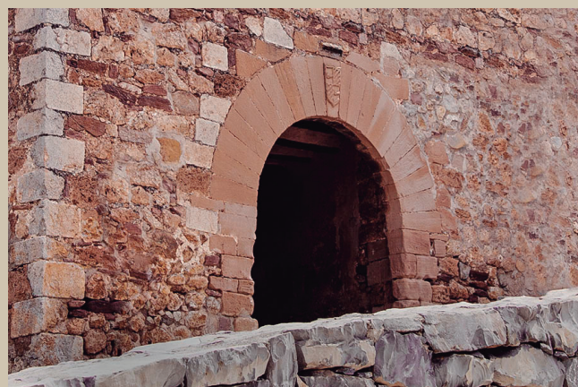
Portal de la Muralla

En el siglo XIV, Andilla perteneció a los Condes de Prades y a mediados del S. XV pasó a manos del matrimonio Diez de Calatayud y Ladrón de Vilanova, cuyos escudos de armas se hallan esculpidos en la portada principal de la iglesia parroquial. Durante el siglo XVII y la primera mitad del XVIII perteneció a las familias Heredia y Rebolledo, este último jefe de los ejércitos del Rey Alfonso el Magnánimo, construyeron la iglesia de la Asunción de Andilla.