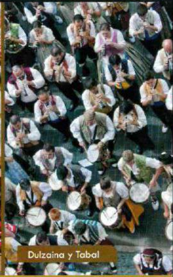
Dulzaina y Tabal

FIESTA DE LA MARE DE DEU DE LA SALUT DE ALGEMESÍ 7 y 8 de septiembre